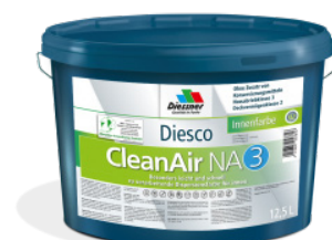
CleanAir NA 3