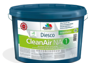
CleanAir NA 1