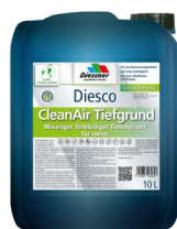
CleanAir Dybdegrunder W