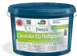
CleanAir EG Haftgrund