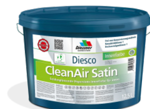
CleanAir Satin vægmaling