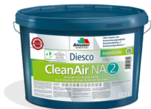
CleanAir NA 2